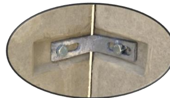
Detail 1 Eckverbindung