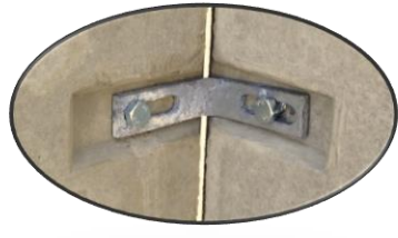
Detail 1 Eckverbindung