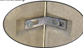
Detail 1 Eckverbindung