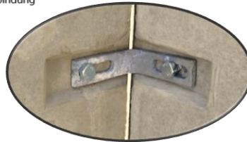
Detail 1 Eckverbindung