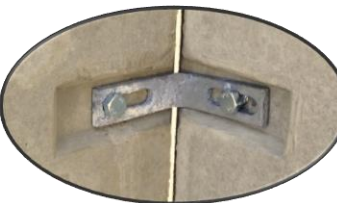
Detail 1 Eckverbindung