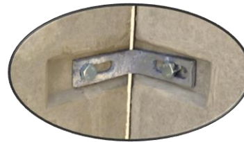
Detail 1 hoekverbinding