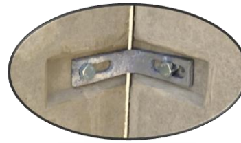
Detail 1 hoekverbinding