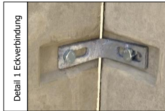
Detail 1 Eckverbindung