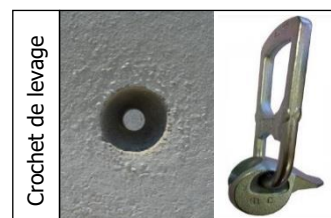
Crochet de levage